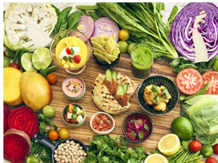
ヴィーガンランチ